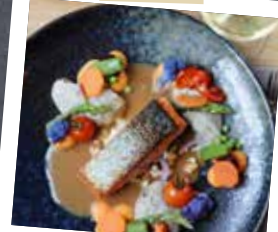
Zalmfilet met kreeftensaus