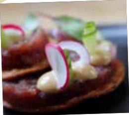
Krokante wrap met tonijntartaar