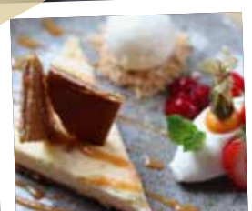
Cheesecake van stroopwafel